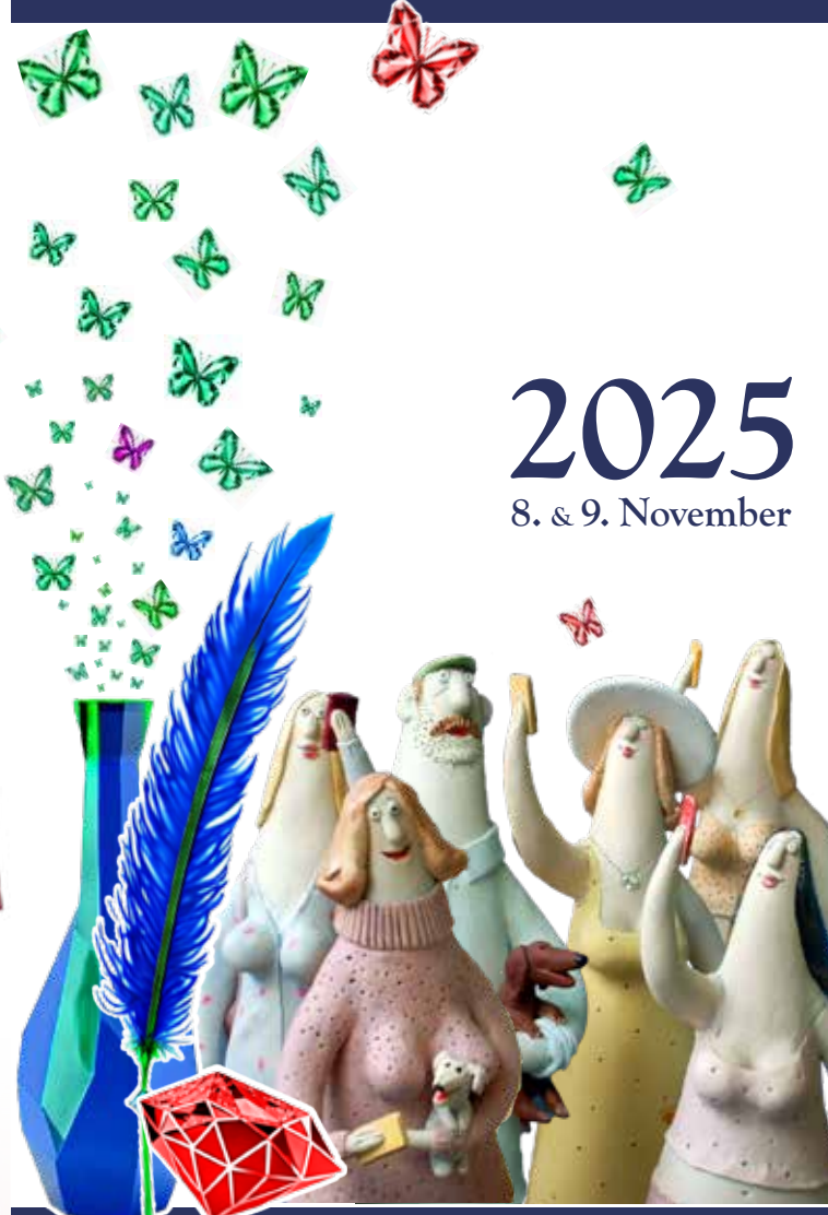
Vorderseite: Tatjana Vodopyan