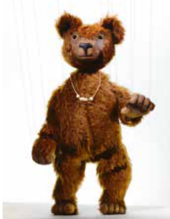
Schmelz & Gmelin